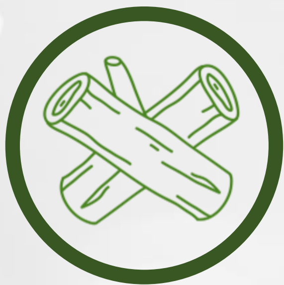
Madera 4 días