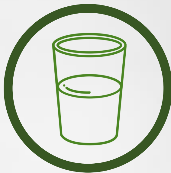
Vidrio 5 días