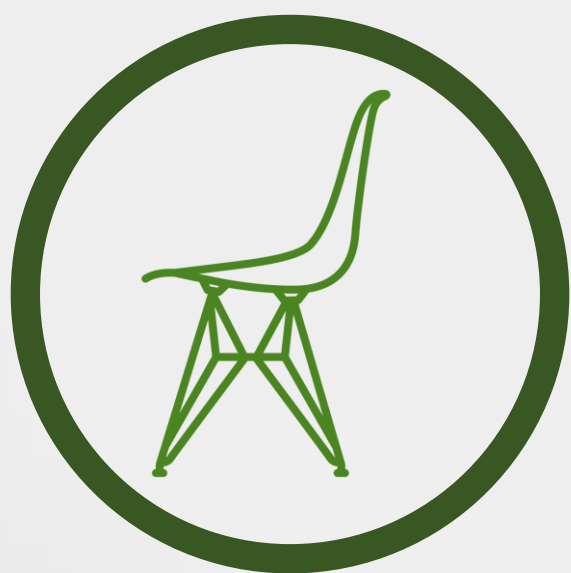
Metal y Plástico 4 a 5 días

En lo posible limpia y desinfecta las superficies, de lo contrario toma las precauciones necesarias y siempre lava tus manos.