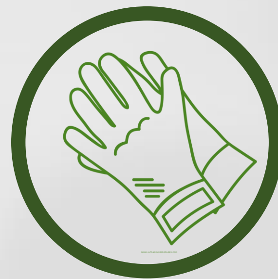
Guantes (latex) 8 horas