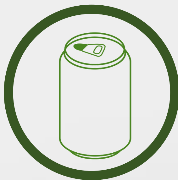
Aluminio 2 a 8 horas